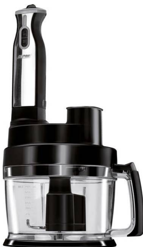
Πολυλειτουργικό Μπλέντερ 800 W MPM MRK-17