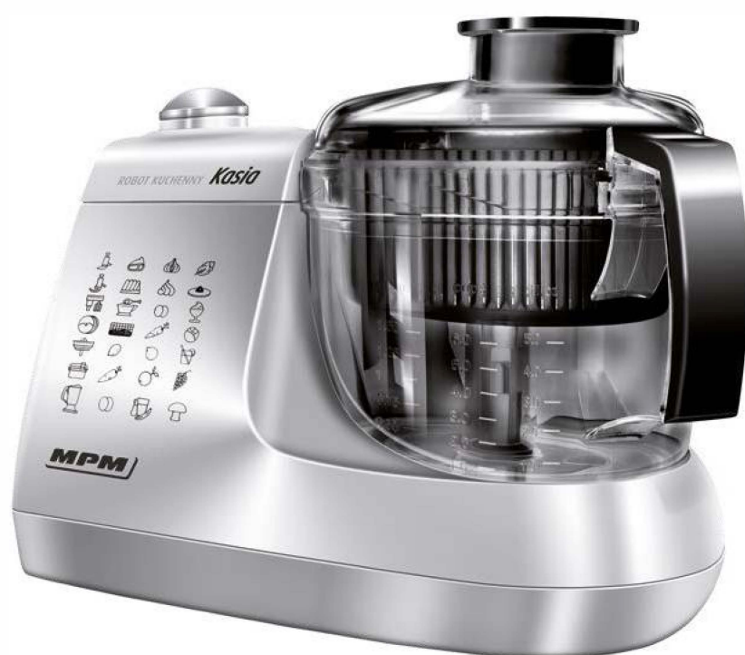
Επεξεργαστής Τροφίμων - Πολυμίξερ 800 W MPM Kasia MRK-12