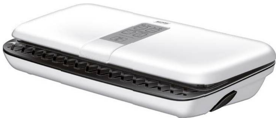
Συσκευή Σφραγίσματος Τροφίμων σε Σακούλα MPM MPZ-01