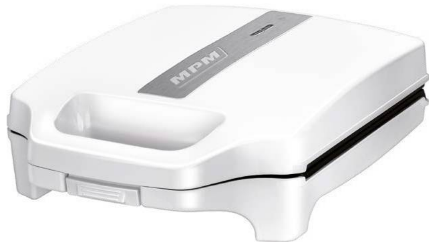
Μοντέλο MOP-35 Τοστιέρα σάντουιτς/Τοστιέρα για σάντουιτς/ Σάντουιτς-Τοστιέρα