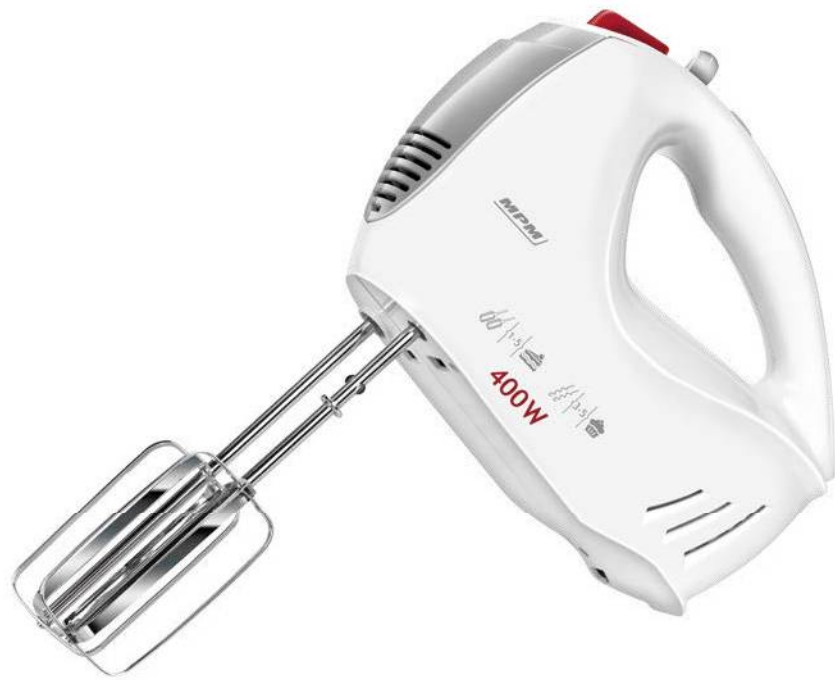
Μίξερ Χειρός MPM MMR-11