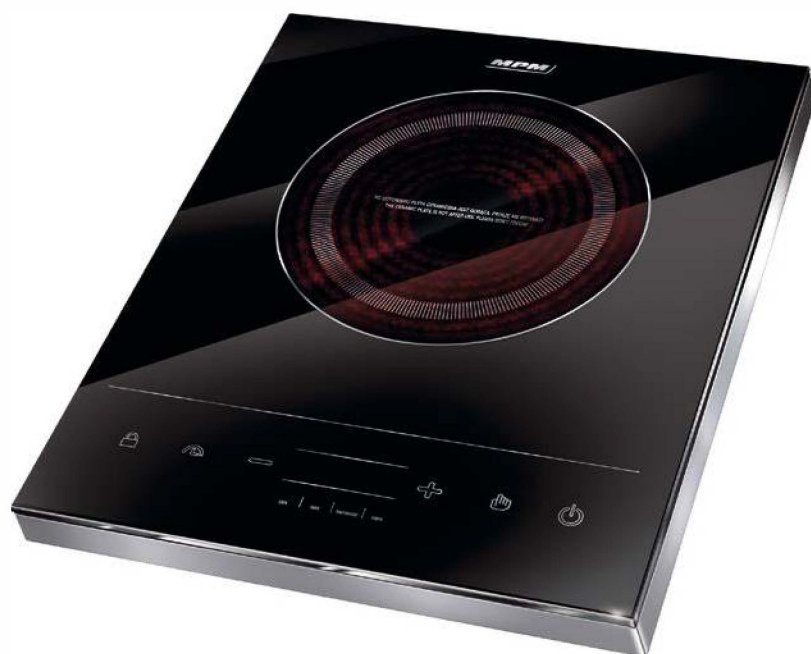
EnaywyLK Ecrla 1800 W MPM MKE-06