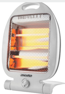
Quartz Heater MS 7710