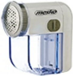
Lint remover MS 9610