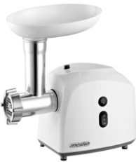
meat grinder MS 4805