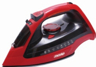
Steam Iron MS 5031