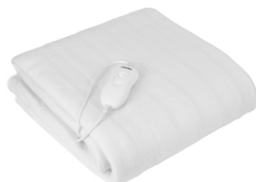
Heating Blanket MS 7419