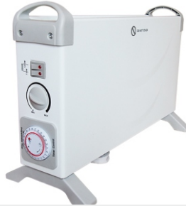
Convector heater MS 7713