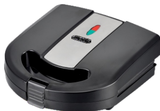
Sandwich Maker MS 3045