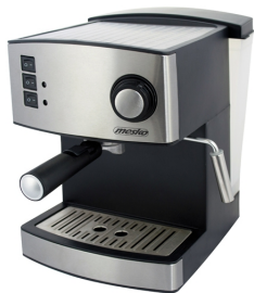
Espresso Machine MS 4403