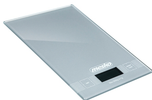
kitchen electronic scale MS 3145