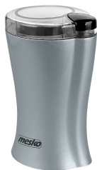
coffee grinder MS 4440