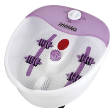
foot spa MS 2152