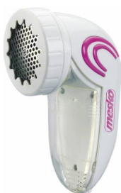
lint remover MS 9607