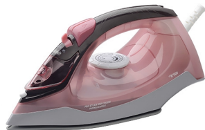
Steam Iron MS 5028