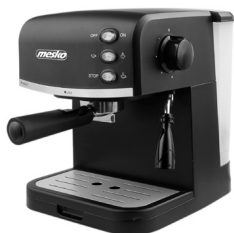
Espresso Maker MS 4409