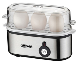
Egg Boiler MS 4486