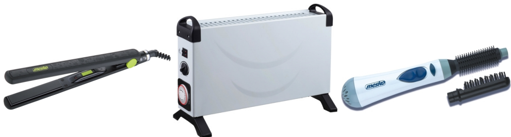
hair straightener MS 2311