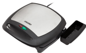
Diet electric grill MS 3035