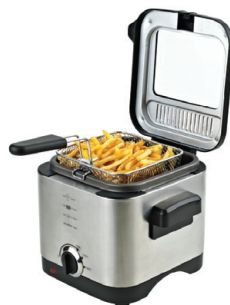
Deep Fryer MS 4910