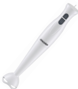
Hand Blender MS 4618