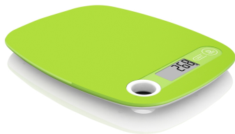
Kitchen Scale MS 3159