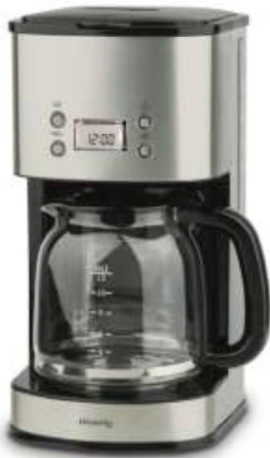
Καφετιέρα Φίλτρου 1.8 Lt Χρώματος Inox H.Koenig MG-30