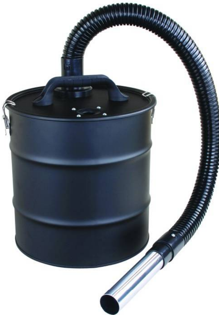
Κάδος Καθαρισμού Στάχτης 20 Lt Kraft&Dele KD-479