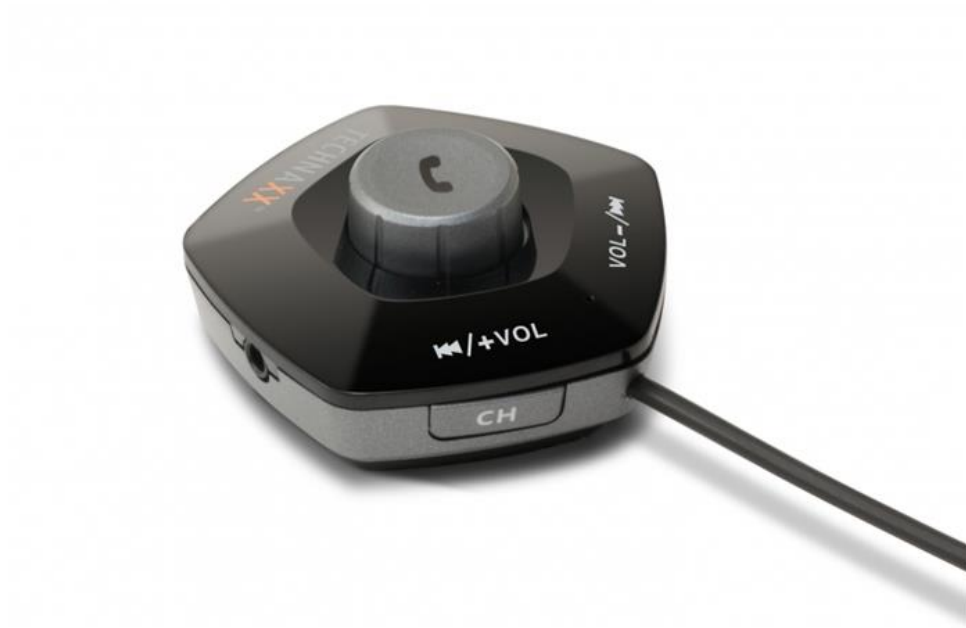
Bluetooth FM Transmitter Technaxx