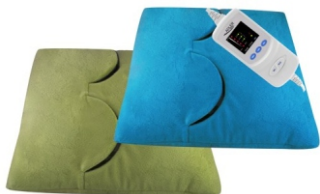
Electric heating pad AD 7403