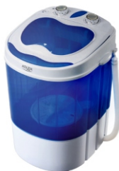
Mini washing machine with spinning function AD 8051