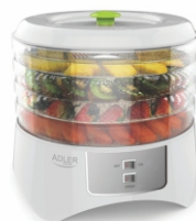
Food dryer AD 6654