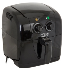
Air fryer AD 6307