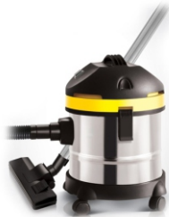
Canister vacuum cleaner AD 7022