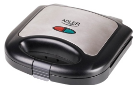
Sandwich maker AD 3015