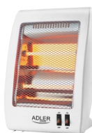
Quartz Heater AD 7709