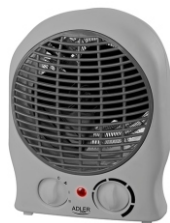
Fan Heater AD 7717