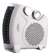
Fan Heater AD 77