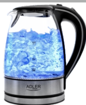
Electric Kettle AD 1225