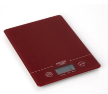
Electronic kitchen scale AD 3138