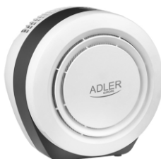
Air Purifier AD 7961