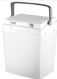
Portable cooler AD 8069