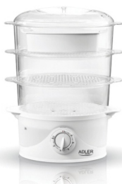
Steam cooker AD 633