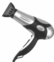
Hair Dryer AD 2224