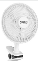
Desk fan 15 cm with clip AD 7317