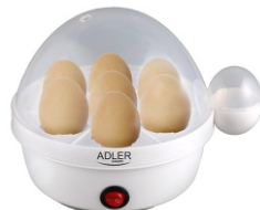
Egg Boiler AD 4459