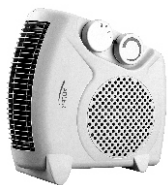
Fan heater AD 77