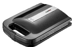
Sandwich Maker AD 3055