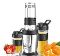
PERSONAL BLENDER AD 4081