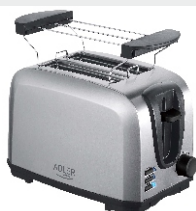
TOASTER 2 SLICE AD 3222