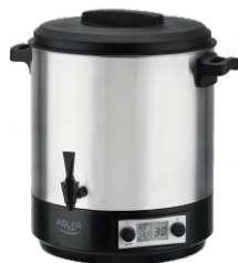
PASTEURIZATION POT AD 4496