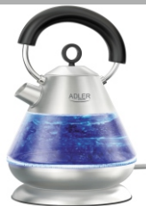
Electric Kettle AD 1282