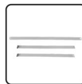
Link span*3 (long*1 short*2)