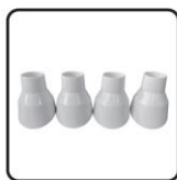
Foot pad *4