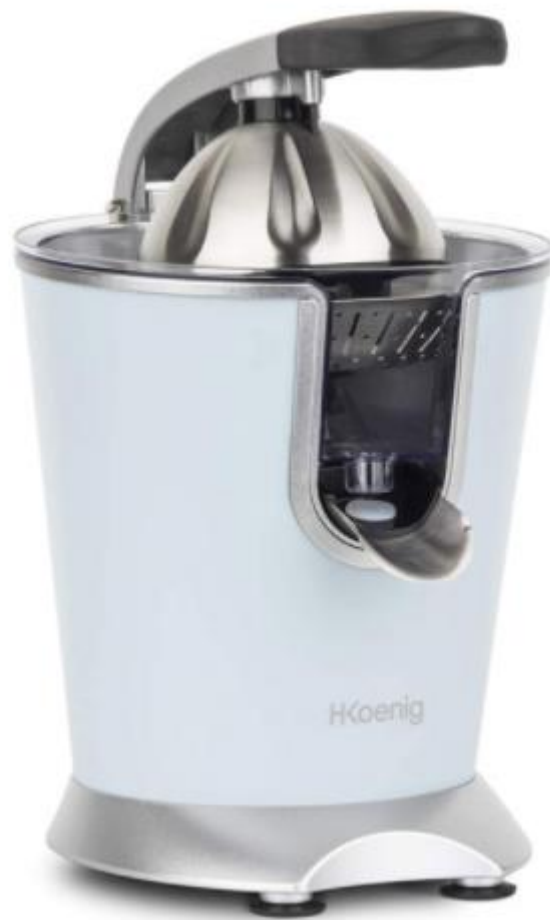
Ηλεκτρικός Στίφτης Εσπεριδοειδών 160 W H.Koenig AGR86 ΟΔΗΓΙΕΣ ΧΡΗΣΗΣ