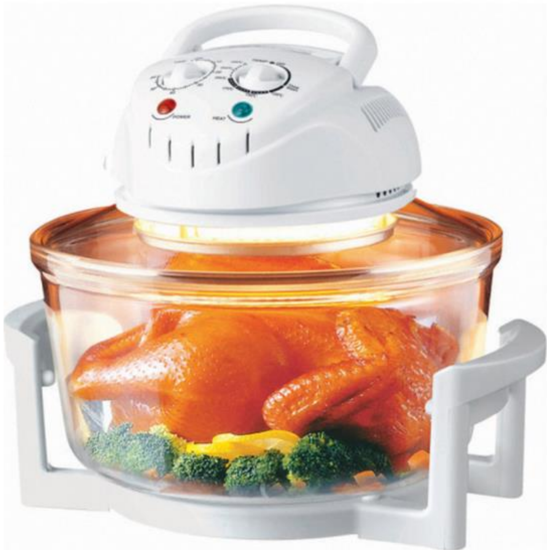
Πολυφουρνάκι Ρομπότ 1400 W JDR